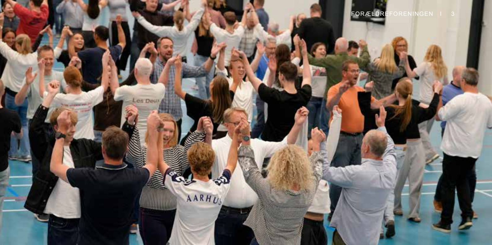
Forældreforeningen var vært for lanciersøveaften for forældrene.