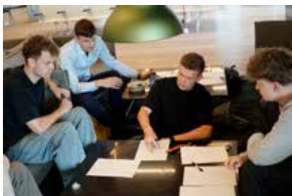
Grundig forberedelse inden oplægget.