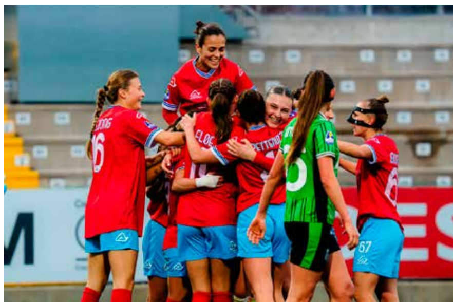
Mille, til venstre, i kamp for Napoli i Serie A Femminile.

faktisk, at sloganet ”SG åbner verden” er meget sigende. Jeg oplever at have fået en bagage med fra min gymnasietid, der gør, at jeg kan forholde mig kritisk til verden og møde mine medmennesker med tolerance, åbenhed og forståelse.