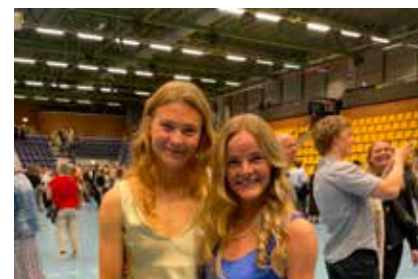
Til lanciers i Jysk Arena, 2022.

Det er derimod gennem fodbolden, jeg har fået mine tætteste venskaber. Dét at være en del af et hold og arbejde mod et fælles mål, giver mig noget helt særligt. Derudover drager folk i vidt forskellige retninger efter gymnasiet, så det kræver en aktiv indsats at holde kontakten.”