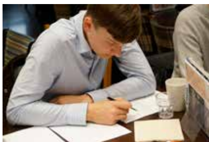
Dyb koncentration inden fremlæggelsen.