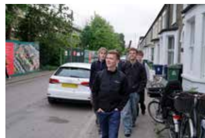
Der var også tid til byvandring i Cambridge.