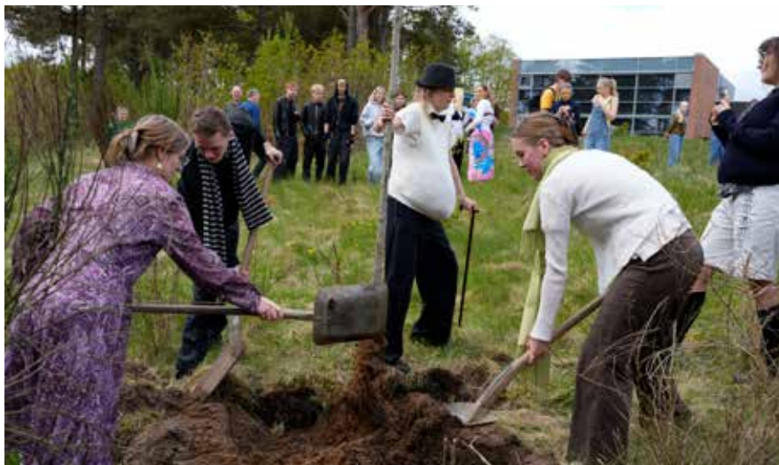
3.g'erne planter deres årgangstræ 2026. Et grønt minde om deres tre år på SG.

Men det, der fylder mest på SG lige nu, er naturligvis 3.g'erne, der befinder sig i en helt særlig tid. En tid, fuld af forventninger til – og måske også en smule nervøsitet over – eksamenstiden og den efterfølgende studentertid. På den måde har skoleåret på SG sit helt eget kredsløb. Et kredsløb, der nu afsluttes for vores kommende studenter.